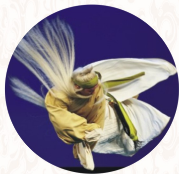
湖北省地方戏艺术剧院楚剧班《扫雪大碗》 获湖北首届地方戏艺术节“表演一等奖”

培养目标： 本专业培养德智体美劳全面发展，掌握扎实的科学技术文化基础和戏曲发展史、戏曲理论、乐理、文艺活动策划等知识，具备戏曲表演基本功、戏曲人物形象塑造、戏曲唱腔和身段指导等能力，具有精益求精、守正创新的精神和信息素养，能够从事戏曲表演、群众文化活动服务与指导、艺术辅导等工作的高素质技术技能人才。