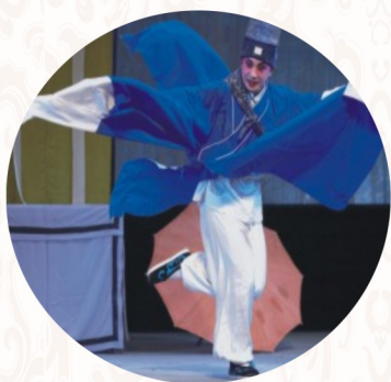
湖北省地方戏艺术剧院楚剧班《风雪夜》 或湖北省首届地方戏艺术节“表演二等奖”