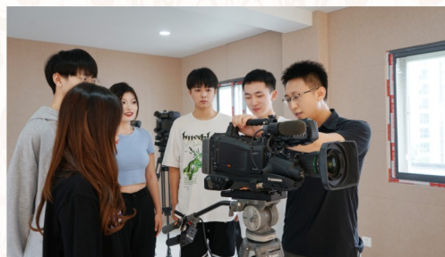
专业实训室（直播间）

培养目标： 本专业培养德智体美劳全面发展，掌握扎实的科学文化基础和戏剧表演、影视表演、编剧与创作等知识，具备舞台剧目和影视作品的角色塑造、文艺活动策划与主持等能力，具有精益求精、守正创新的精神和信息素养，能够从事戏剧表演、影视表演、旅游演艺表演、文艺活动策划与主持等工作的高素质技术技能人才。