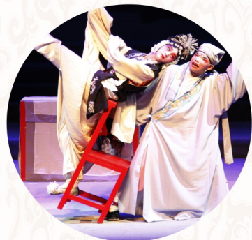
仙桃花鼓戏剧目汇报