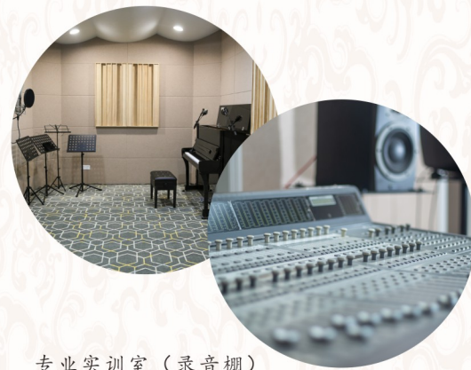
专业实训室（录音棚）

培养目标： 本专业为新媒体视听行业、文化艺术行业等新兴行业的发展而设置，为湖北省内独家开办。依托我校在文化艺术行业的独特优势，通过三年理论知识和实际操作能力的训练，使学生具有熟练操作和运行专业舞台灯光、数字视听系统、专业音响设备，掌握专业灯光、摄影、音频等相关专业技术。该专业人才缺口大，发展前景广阔，具有巨大的就业前景。